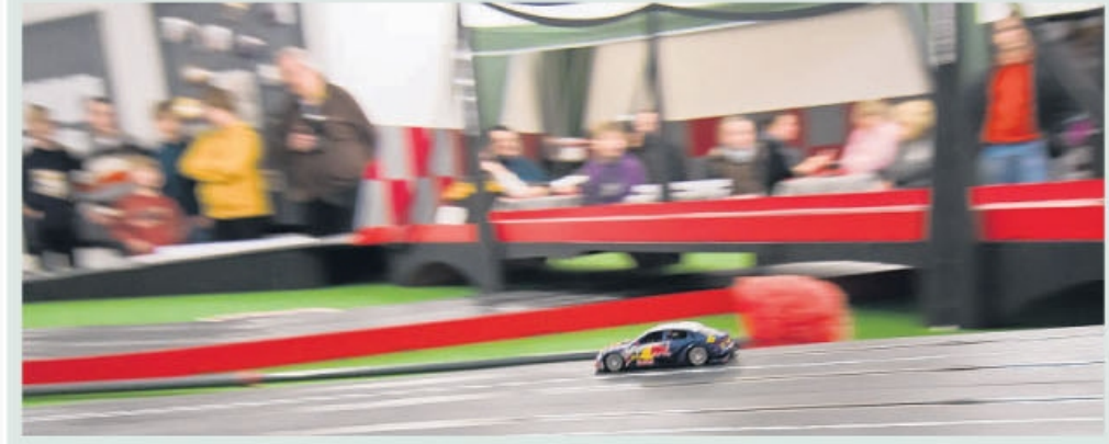
Tribüne, Boxengasse, Bandenwerbung - wie bei der Formel 1, nur viel kleiner. Am Wochenende wurden auf der Carrerabahn „rennspass oberhausen“ die Saisonfinals ausgetragen, in der Kinder- und der Erwachsenenwertung. Insgesamt gab's sechs Titelanwärter. Lokalseite 3