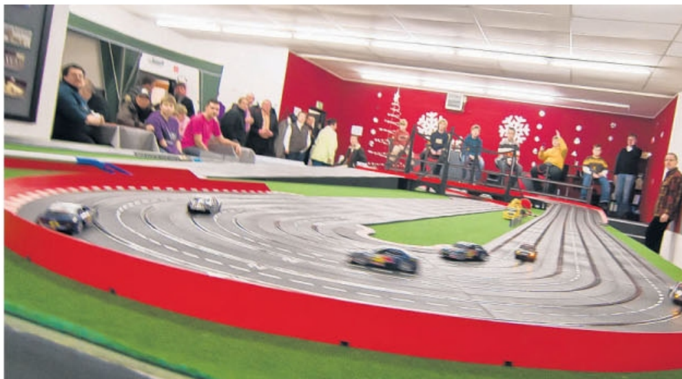
Auf der Carrera Bahn Oberhausen ging's am Wochenende beim Finalrennen um den Champions-Titel. Hier das Kinder-Finale.

Das Carrera-Bahn Oberhausen ging's am Wochenende beim Finalrennen um den Champions-Titel. Hier das Kinder-Finale.